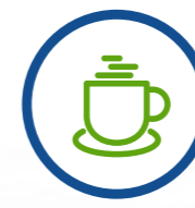
Caffetterie e bar