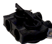
Bypass ze plastiku