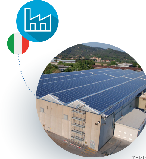
Zakład produkcyjny Fleck w Pizie we Włoszech.

Od lat 70-tych, głowice Fleck (z wyjątkiem najnowszej głowicy 5810 i głowicy 5812) są montowane w Europie, co jest wygodniejsze dla europejskich klientów. Obecnie produkcja odbywa się w naszym europejskim centrum głowic w Pizie we Włoszech, gdzie już wcześniej były montowane głowice Autotrol i Siata.