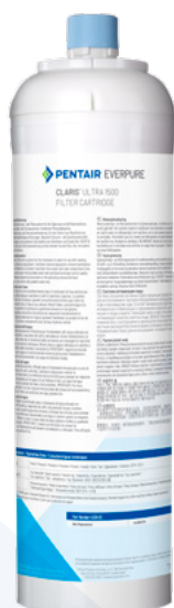
Tête vendue séparément.

CARTOUCHE DE FILTRATION CLARIS ULTRA 1500 : 4339-83