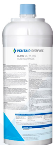
Kop apart verkocht.

CLARIS ULTRA 1000 FILTERPATROON: 4339-82